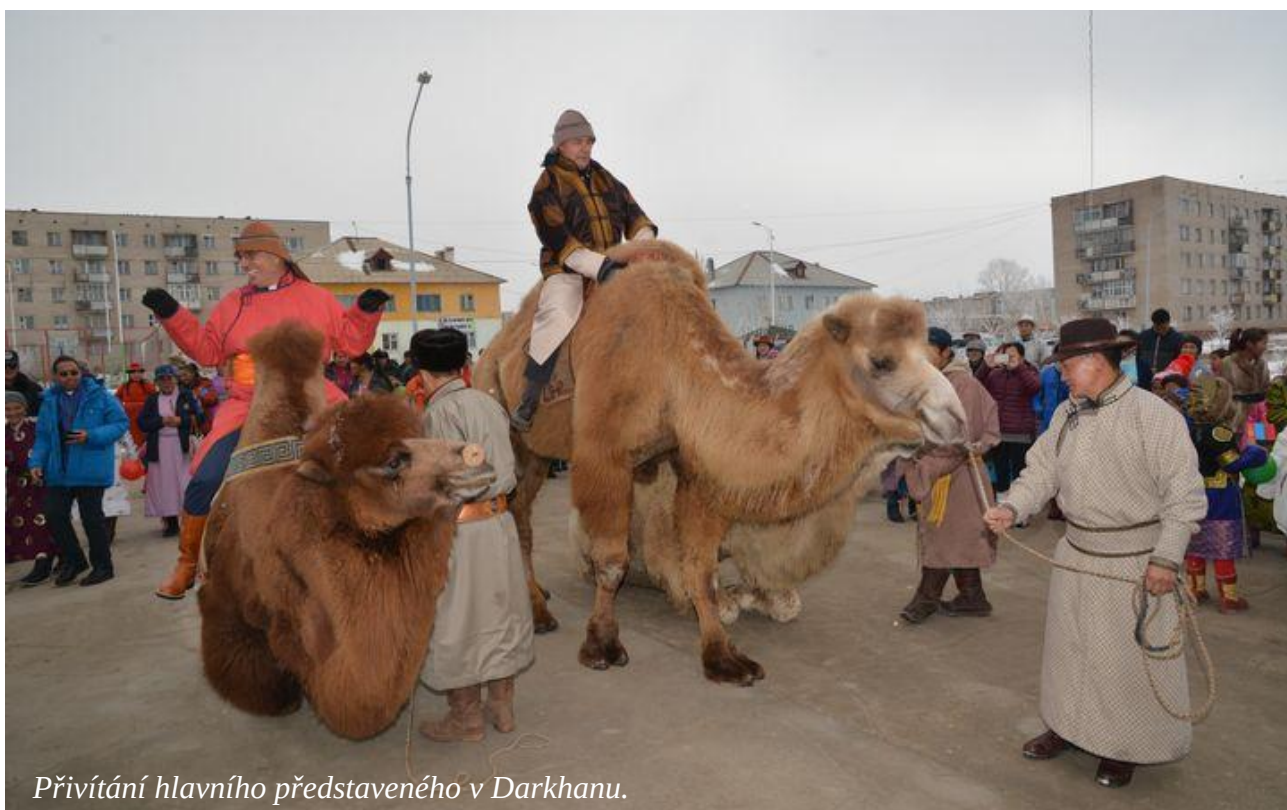
Přivítání hlavního představeného v Darkhanu.