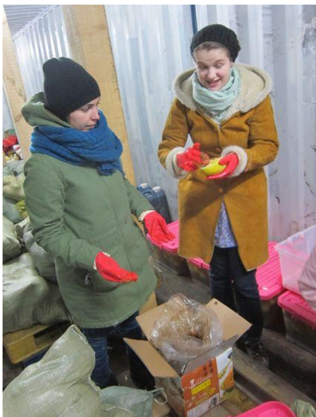
České studentky mongolistiky ve sklepě na naší farmě poblíž Darkhanu.

instalaci. Kdybyste ji viděli, vůbec byste se nedivili. Budova je tak jako tak určená k demolici. Na jejím místě bychom chtěli postavit nové centrum pro mládež s tělocvičnou, tolik potřebnou během 8 měsíců dlouhé mrazivé zimy.