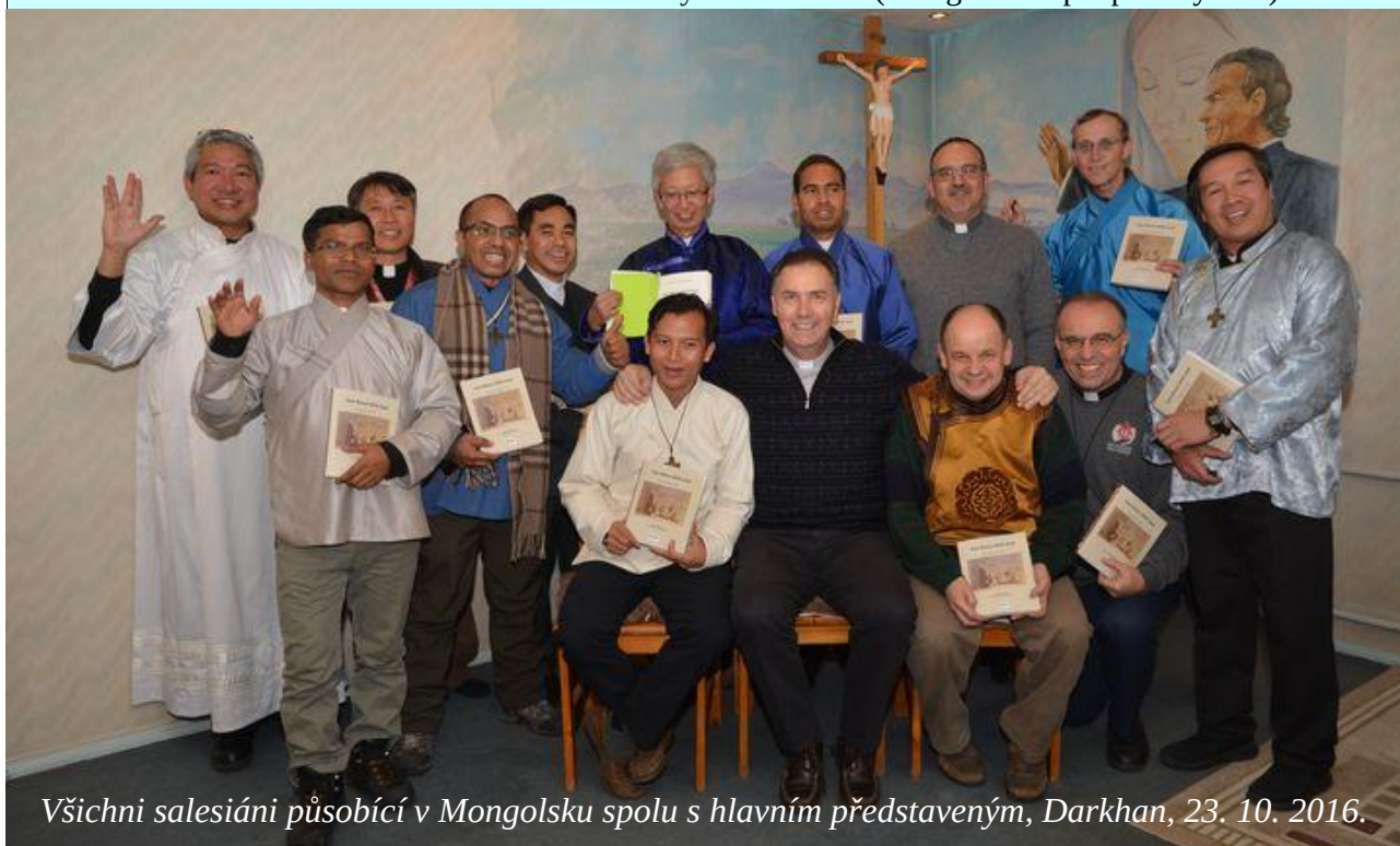
Všichni salesiáni působící v Mongolsku spolu s hlavním představeným, Darkhan, 23. 10. 2016.

• číslo účtu: 16844021/0100 • variabilní symbol: 15101 (Mongolsko – podpora vyslání)