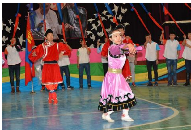
Tanečnice v mongolských národních krojích.