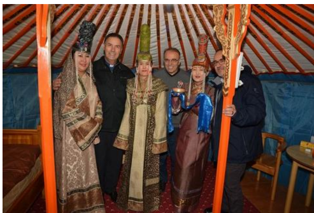
Hlavní představený byl ubytován v geru postaveném uvnitř místnosti.

Na začátku listopadu jsme zde měli nečekanou událost – požár v klinice v budově oratoře. Původně to byla továrna na zmrzlinu, poté kostel a v posledních letech oratoř s malou klinikou či ordinací na poskytnutí zdravotní pomoci místním chudými lidem. A právě v této klinice nečekaně vznikl požár, snad díky vadné elektro-