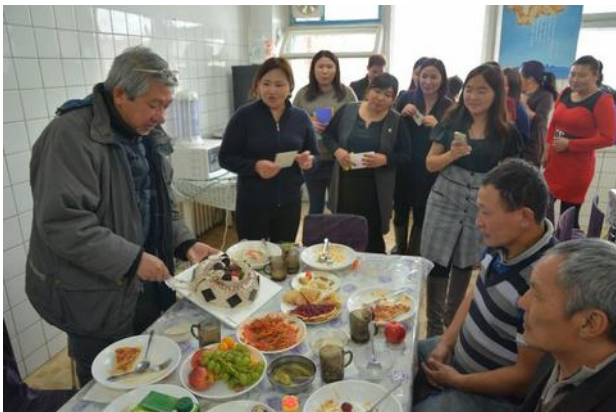
Den vděčnosti při příležitosti svátku našeho ředitele.