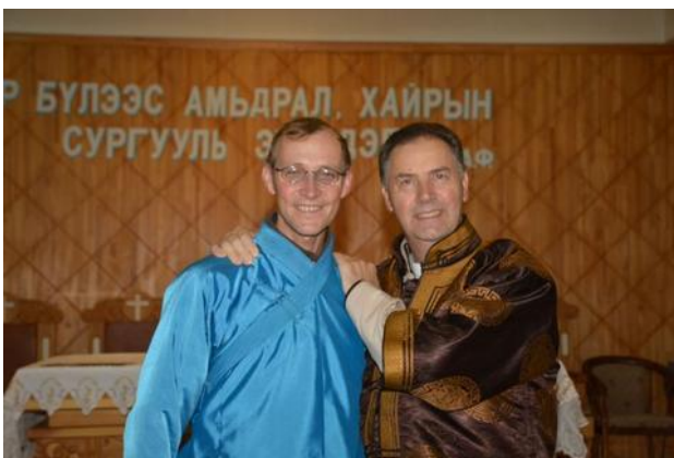
Společně v Darkhanu v kostele Panny Marie Pomocnice křesťanů.