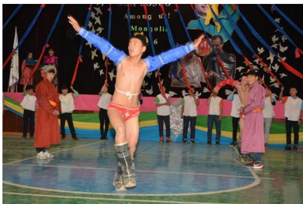
Slavnostní akademie žáků školy Don Bosco na počest příjezdu hlavního představeného.